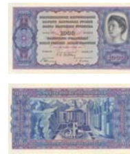
4. Serie nicht emittiert