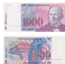
7. Serie nicht emittiert