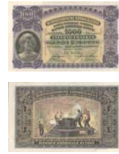
2. Serie 1911–1958 (1980)