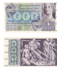
5. Serie 1956–1980