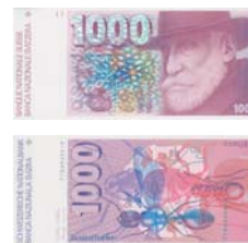
6. Serie 1976–2000